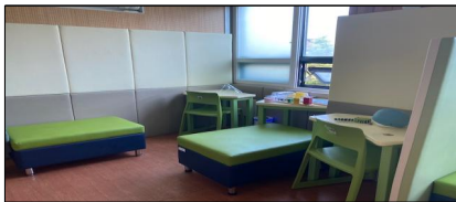
[ 적용 전 ]